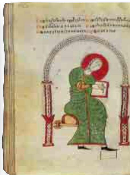
Kopitarova bosanska Evandjelja: početak Evandjelja po Mateju, po Ivanu i portret evanđelista Luke

etabliranih Crkava na Istoku i Zapadu znači vraćanje Crkve bosanske u njezin svijet i povijesni kontekst u kojemu je politički moral bio tijesno povezan s konfesionalnim pretekama.