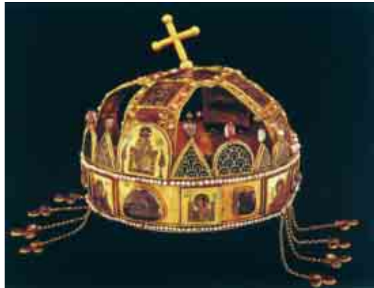
Sveta kruna ugarska

O bazilijanskoj orijentaciji Crkve bosanske svjedoči i učeni isusovac Daniel Farlati koji spominje metropolita ili igumana mileševskog bazilijanskog manastira u ulozi osobe koja je 1377. godine okrunila kralja Tvrtka I. Kotromanića. Ovoj mogućnosti cijena bi dodatno porasla kada bismo mogli biti sigurni u postojanje jednog bazilijanskog samostana u dolini Vrbasa, kao što smo sigurni u prisutnost bazilijanskih samostana u Italiji i ostalom Sredozemlju, odnosno u utjecaje benediktinskog i bazilijanskog reda prisutne još od vremena kristijanizacije obalnog područja Jadranskoga mora i njegove unutrašnjosti – što znači i srednjovjekovne Bosne. To, istina, još uvijek ne daje konačan odgovor na pitanje bazilijanske orijentacije Crkve bosanske, odnosno ne rješava enigm: kada i kako je ova autokefalna crkvena organizacija usvojila regulu sv. Bazilija, koja je preko benediktinskog pravila utjecala i na