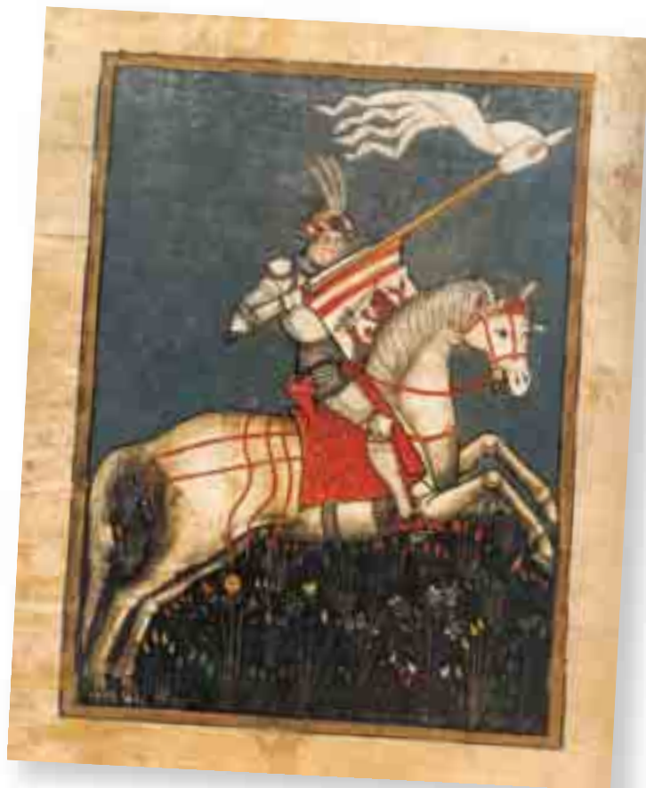
Lik Hrvoja Vukčića Hrvatinića iz Hrvojeva misala

Proširenje palete izvora objavljivanjem dubrovačkih i osmanskih podataka zaoštrilo je pitanje karaktera heterodoksije Crkve bosanske – naime, je li ona bila bogumilska odnosno dualistička ili pak samo raskolnička ali ne i heretična u strogom značenju te riječi, ili pak nešto treće? Dobar poznavatelj bosanskog srednjovjekovlja, srpski povjesničar Sima M. Ćirković odlučio se na prevladavanje ove dileme sinkretističkom sintezom , prema