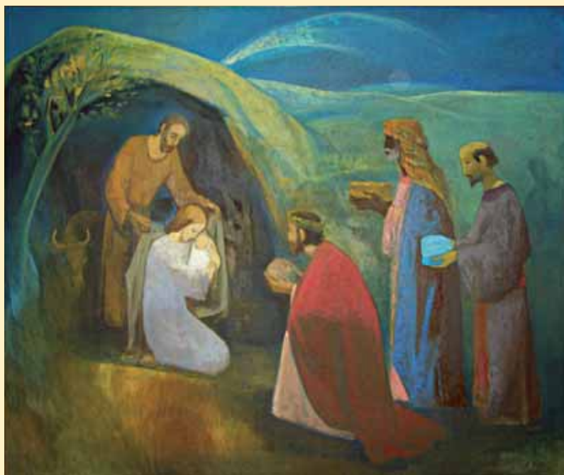
Josip BIFFEL, Poklon mudraca

Obdarenost Betlehemom upućuje na Betlehemsku odgovornost. Biti dionikom te odgovornosti osobiti je dar koji određuje i pokreće čitavo čovjekovo biće. Sve njegovo djelovanje. Može čovjek kroz svoje dane na mnoge načine biti bolno, prebolno okraden, temeljna istina o njemu i nadalje ostaje obdarenost. Ne okradenost. Pristati na okradenost, značilo bi zanemariti obdarenost. Otkloniti je kao nešto neželjeno. Kao nešto neprikladno.